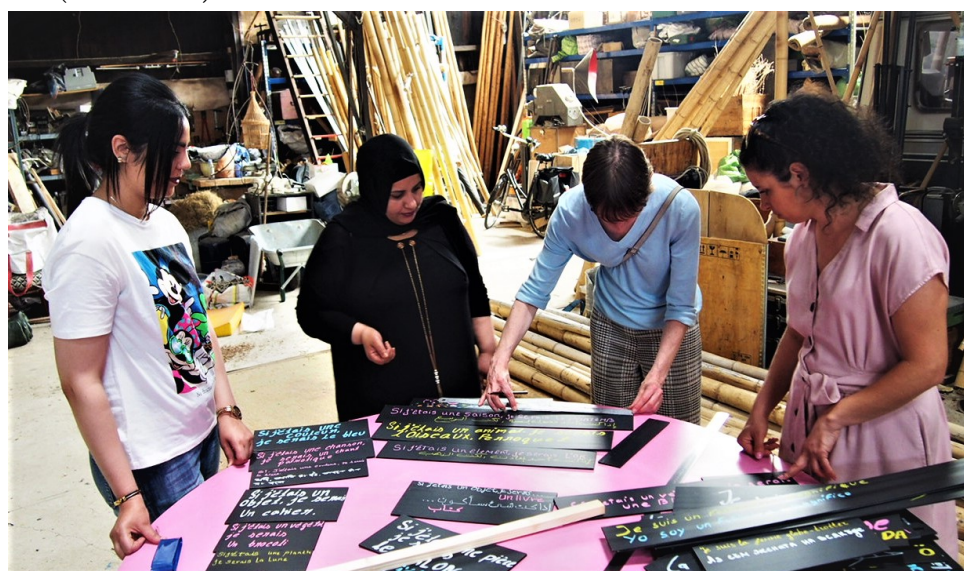
Manufacture ouverte avec les participants des ateliers ELF de l'ASEA - Juin 2019

A noter : le contenu des manufactures peut varier selon les désirs exprimés par les participants, l'objectif est d'aller vers de plus en plus de co-construction dans le cadre de ce projet.