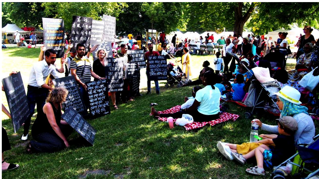
Fête de la ville et des associations 2019

Déposé en wolof par Yacine Diop-Diakité le 18 janvier 2014