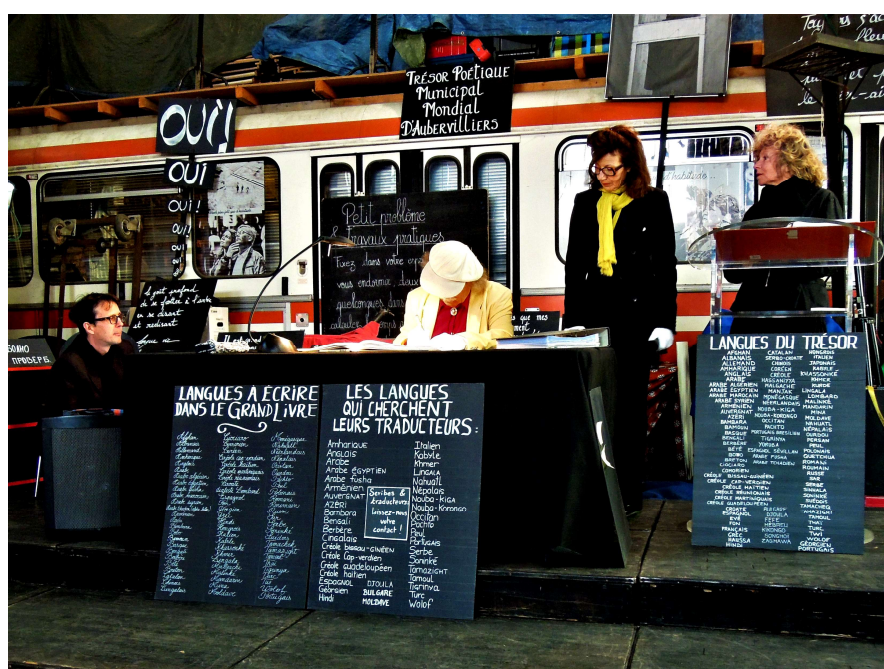
Journée du versement au Trésor poétique, Septembre 2020

La valorisation des paroles poétiques lors des Temps forts correspond à un besoin de partager en espace public les mots des bénéficiaires, valorisant ainsi leur créativité et les invitant à s'exprimer publiquement.