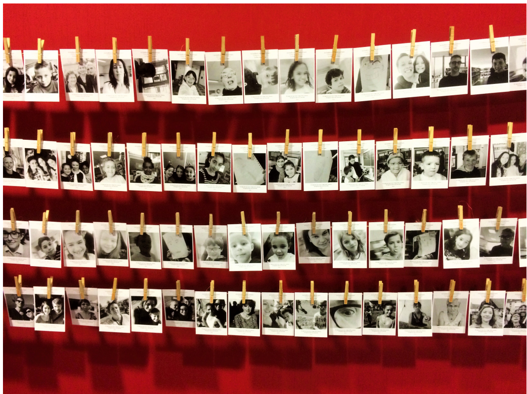
Portraits selfies – ©Les Souffleurs commandos poétiques

PROJET À FORT POTENTIEL DE PARTICIPATION COLLECTIVE AVEC LE COLLÈGE GISÈLE HALIMI