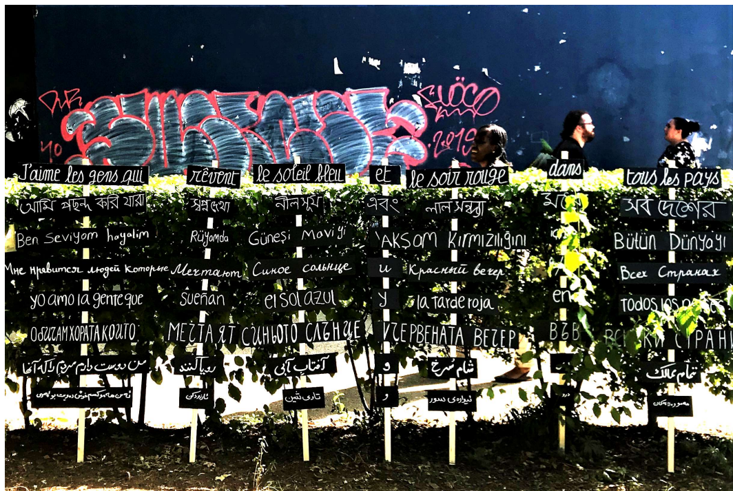
Fête de la ville, Juin 2019