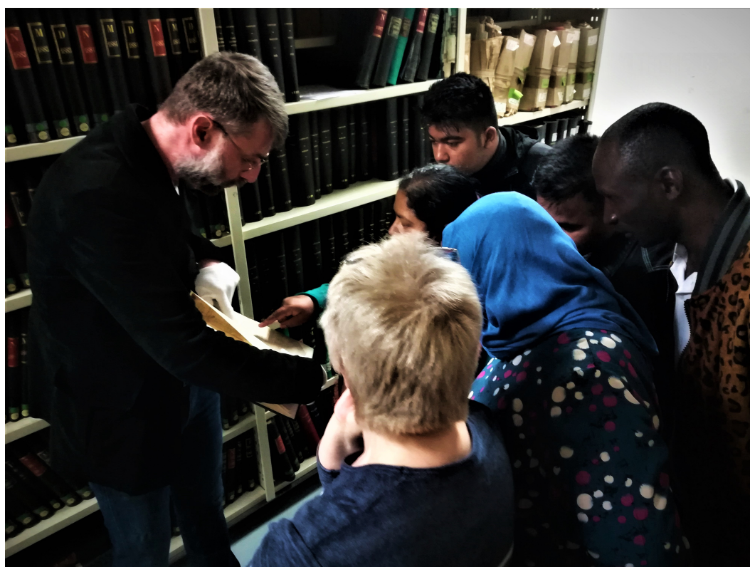
Manufacture avec les participants des ateliers ELF de l'ASEA